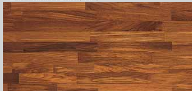
TEAK PRIMA VERNICIATO