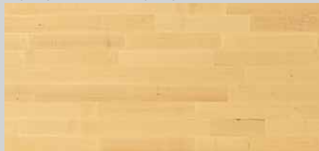
ACERO PRIMA VERNICIATO