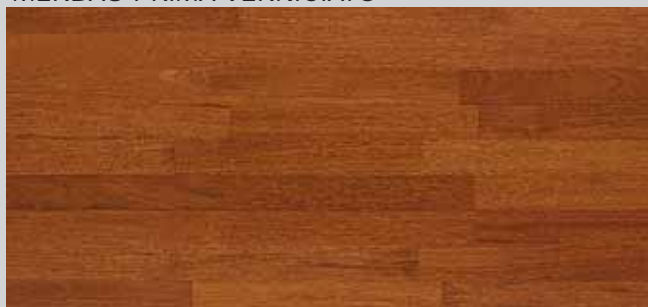
MERBAU PRIMA VERNICIATO