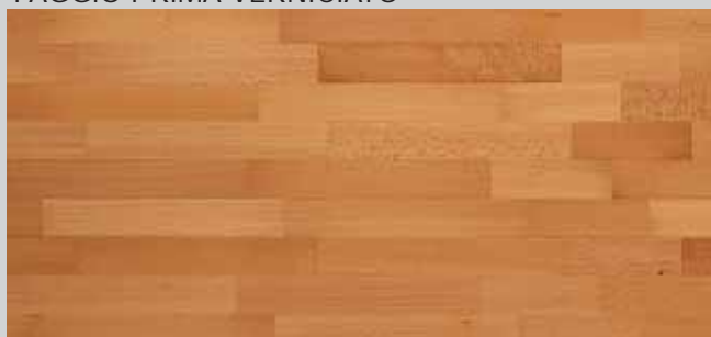
FAGGIO PRIMA VERNICIATO