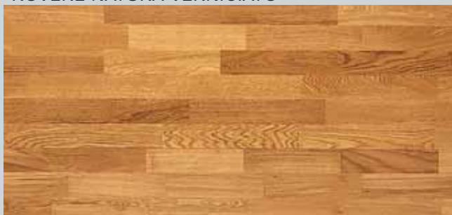
ROVERE NATURA VERNICIATO