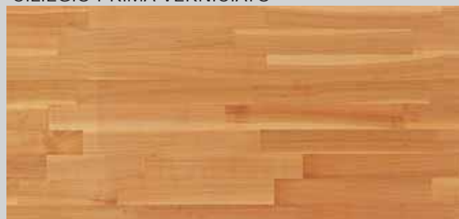
CILIEGIO PRIMA VERNICIATO