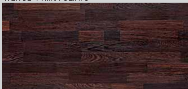
WENGE' PRIMA OLIATO