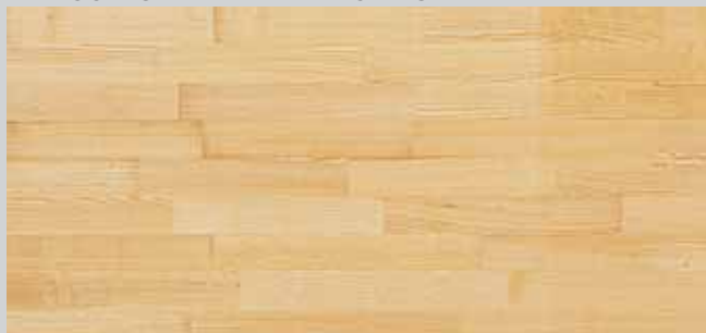
FRASSINO PRIMA VERNICIATO