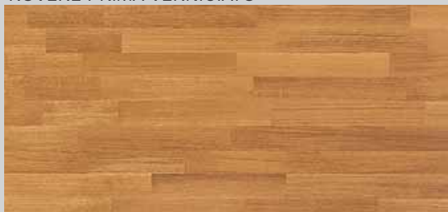
ROVERE PRIMA VERNICIATO